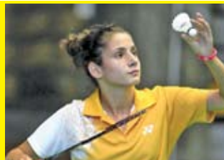
Златното момиче на тихата 26-24 олимпиада