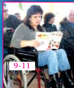
9-11 Тук се чувстват разбрани...