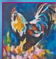
Среднощни петли 4-6