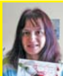
Избираме лица на КУРАЖ 22-24