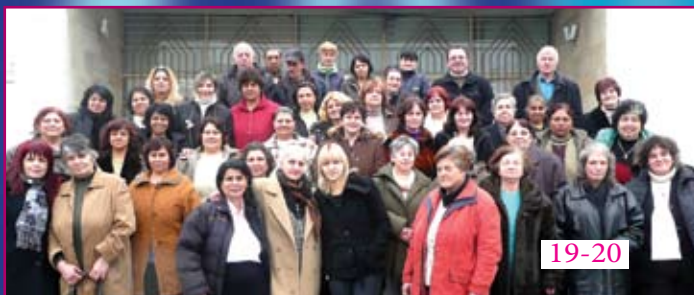
19-20 Домашни помощници в Перущица