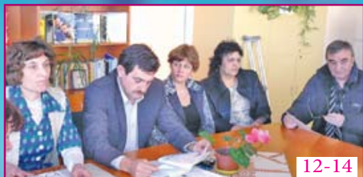
12-14 Много радост и възбуждания...