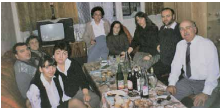
Празници с фамилията и със съседите