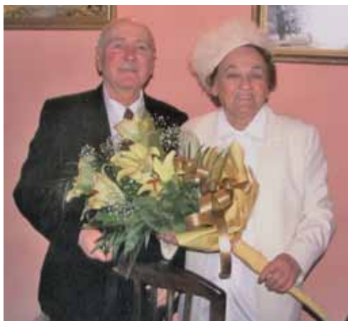
На "Златната сватба"

сложат мен и мъжа ми в един цепелин и да ни пуснат – да летим така, слети един до друг, завинаги да сме заедно! Аз рядко съм виждала такива мъже като моя... Той е строг, сериозен, справедлив, всеотдаен към децата си. Аз мога да бъда и мекушава, и разумна, и да сбъркам, но той е праволинеен...»