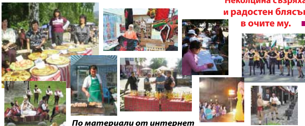
По материали от интернет

А той бе там. Скулптурата му на площада посрещаше и изпращаше всеки, дошъл за празника в любимото му село. Неколцина съзряха и радостен блясък в очите му. ■