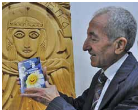
Майстор на дърворезбата

В музея на братя Панайотови освен вещи от Балабановата мукавена фабрика се съхраняват и уникални снимки на Богдан Филлов, който като министър-председател посещава фабриката, както и уникални от съществувалата до 1960 година теснолинейка от Кочериново до Рилския манастир.