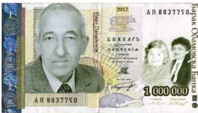
Банкнотата от 1 милион лева на Баракоба-новската банка с лика на своя създател

Бойка в общежитията на фабриката в Бараково. В съхранената от Панайотови фабрична ведомост стои оригиналният подпис на поета, който се е разписвал срещу