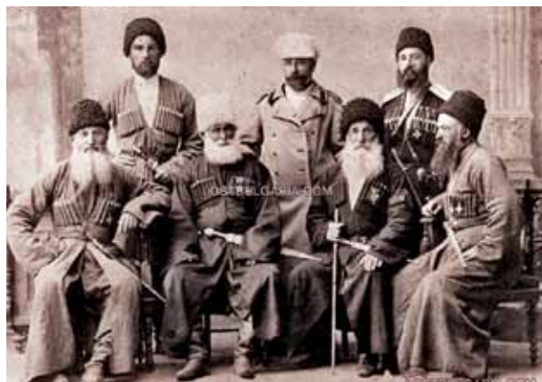
Осетинци, етническа военна част в състава на руската армия, сражаващи се в Руско-турската война 1877-1878 г.