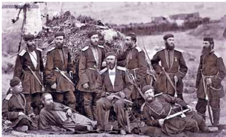
Грузински офицери в състава на руската войска 1877-1878 г.