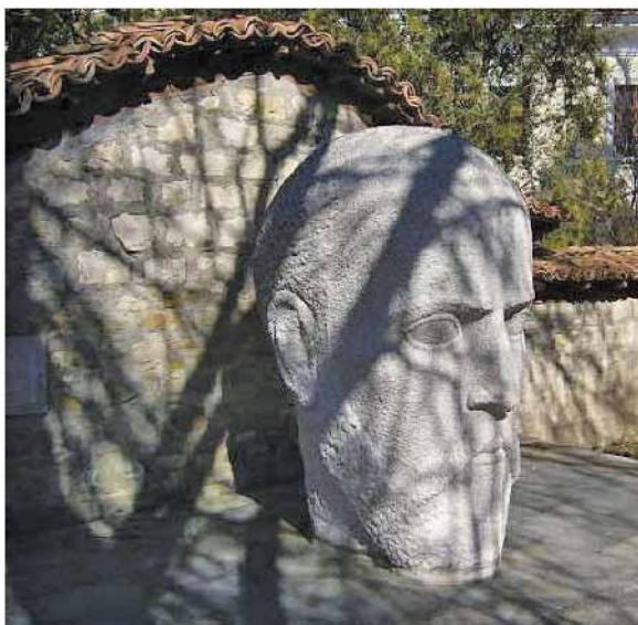
Паметникът на Макгахан в Елена

"В очите на г-н Дизраели - писал Макгахан - голямото престъпление не е това, че са убити хиляди и хиляди души невинен народ, а това, че във