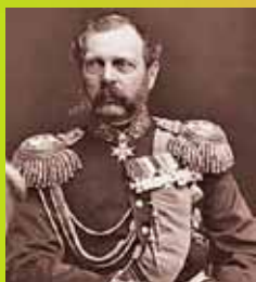
Александър II- Цар Освободител

Макгахан: «Аз мисля, че хората в Англия и изобщо в Европа имат доста погрешна предста- ва за българите....»