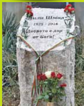
В памет на Лили Шмидт