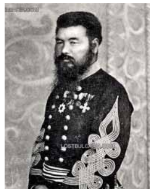
Първият японец, стъпил на българска земя, участник в Руско-турската война на страната на Русия, начело на взвод при обсадата на Плевен, генерал-майор Барон Сейго Ямадазава