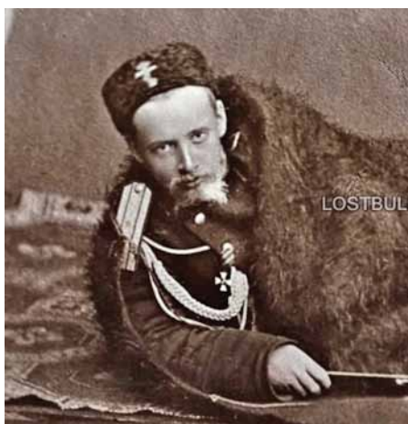
Началник щаба на българското опълчение граф Фьодор Келер, награден с орден "Св. Георги" IV степен след боя при Шейново - заснет в Котел 1878 г.