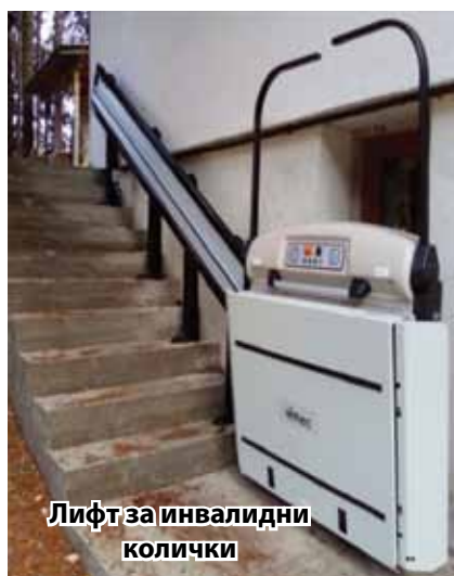
Лифт за инвалидни колички

Заклучението ѝ е, че "развитието на достъпен туризъм би подпомогнало половината от населението на света след 20 години".