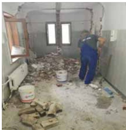
Преди и след ремонта в хижа "Яворов"

Според нейни данни "хората с увреждания по света са 15% от населението, а възрастните хора – 20% от населението, което в перспектива до 2050 г. означава 40%."