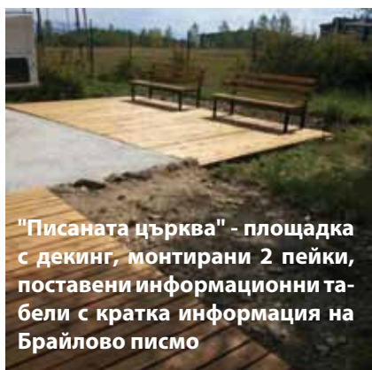
"Писаната църква" - площадка с декинг, монтирани 2 пейки, поставени информационни табели с кратка информация на Брайлово писмо