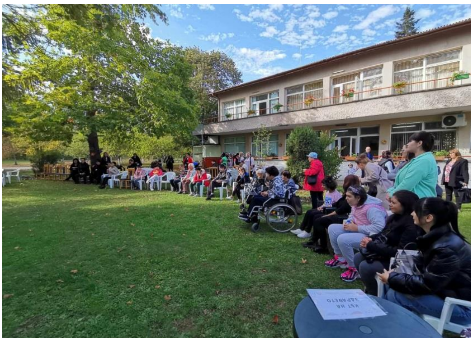
Снимка от 15.10.2024г.