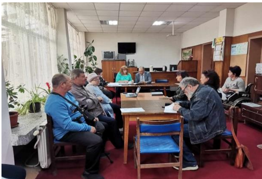
Снимка от пресконференцията на 27.05.2024 г.