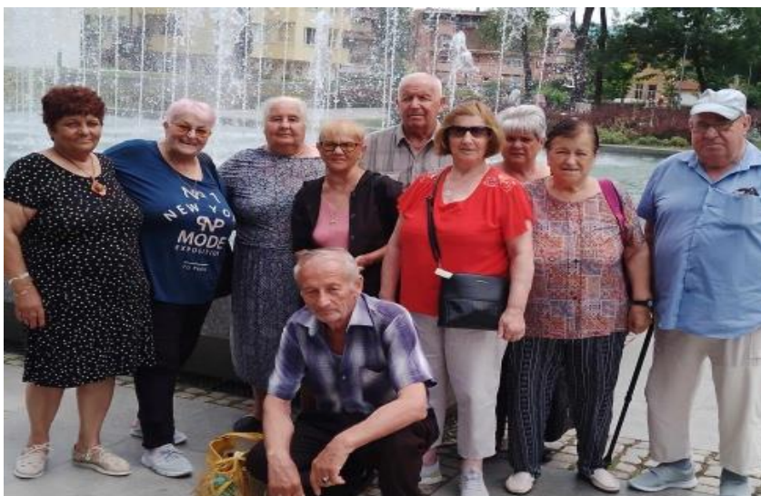
08.09.2024 г. Екскурзия и участие на Фестивала „Синия Дунав“ гр. Видин и Белоградчишките скали