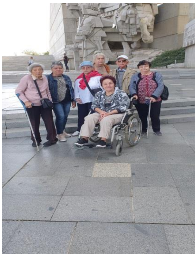
Снимки от 09.10.2024г. Шумен