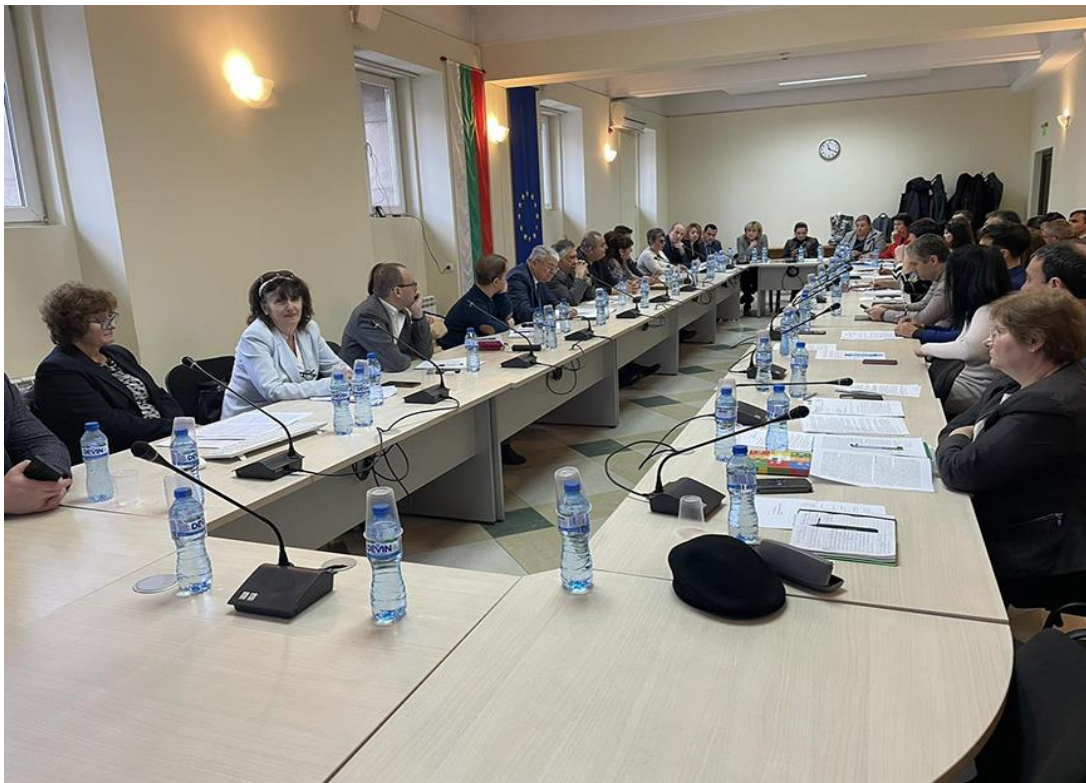
Среща в Столична община – 16.02.2024 г.