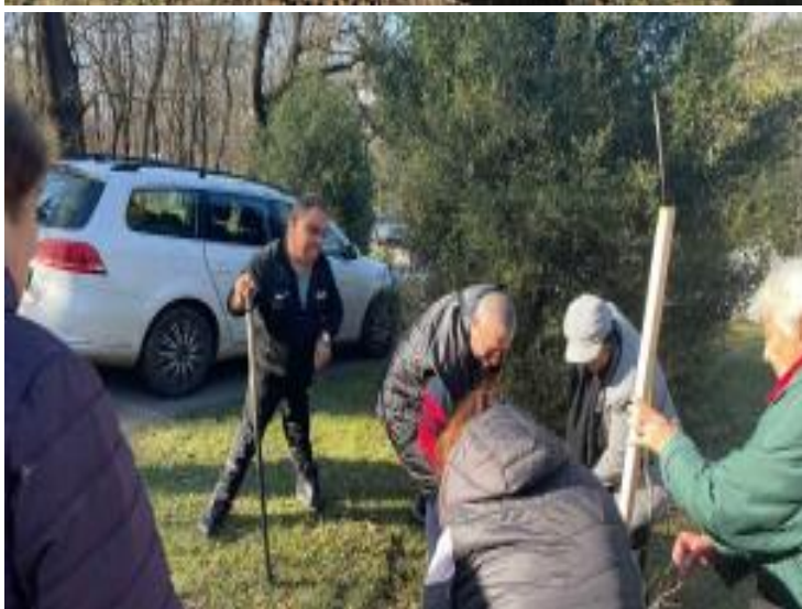
Откриване на втория ден на Фестивала