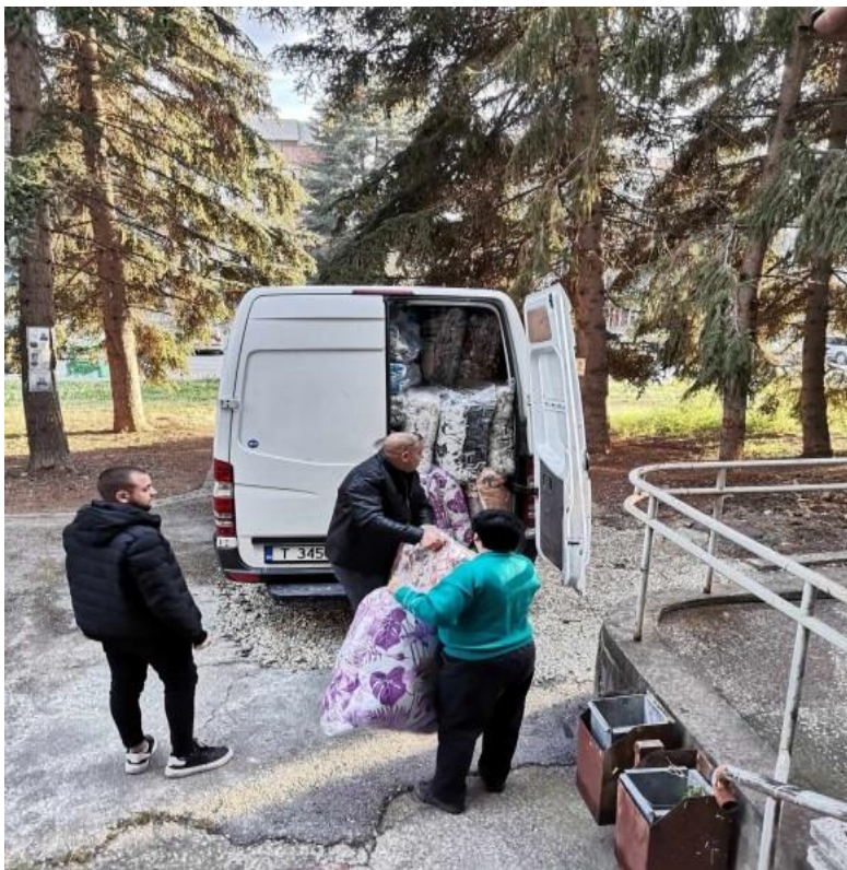
В Комплекс за социални услуги „Вижън“.