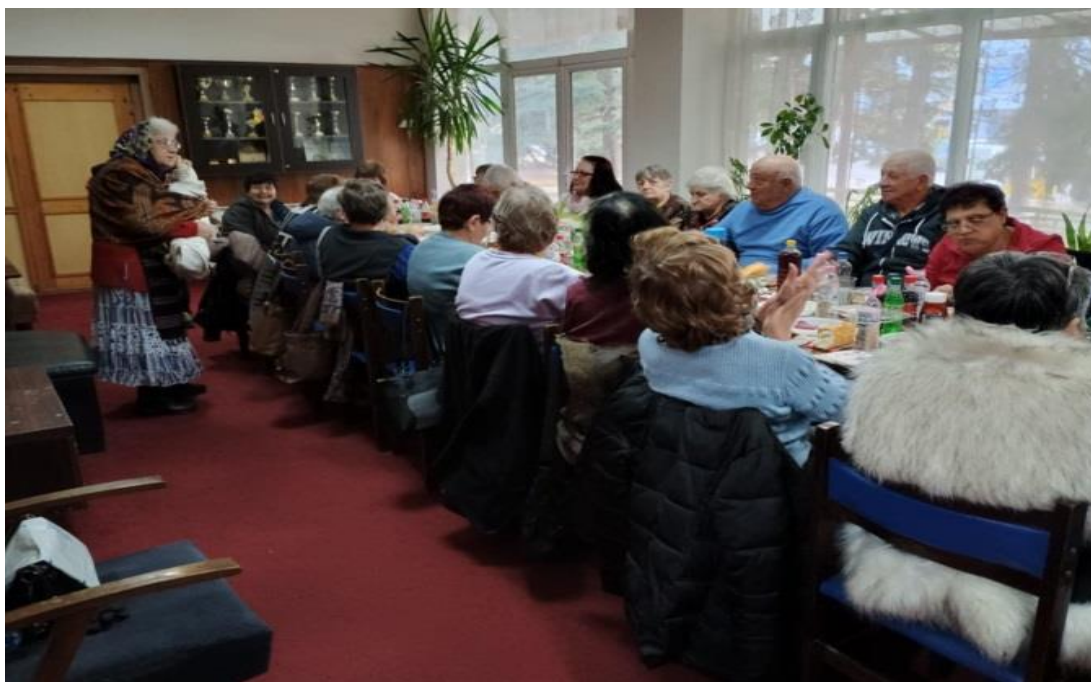
21.01.2025г. Отбелязване на Бабинден в ОО- Търговище

След отбелязването на деня на родилната помощ и бабите, на 14 февруари в ОО- Търговище бе почетен и Денят на лозарите и виното - Трифон Зарезан.