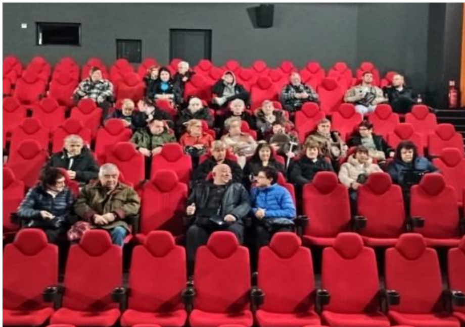
09.01.2025 г. Кино "CineLand", прожекция "Гунди- Легенда за любовта"

С ентузиазъм и дейно присъствие се прие от членовете на търговищката организация идеята за посещение на кино. С предварителна договорка кино салонът отвори врати само за наши членове, които посетиха прожекциите „Без крила“ и „Гунди- Легенда за любовта“, на преференциални цени.