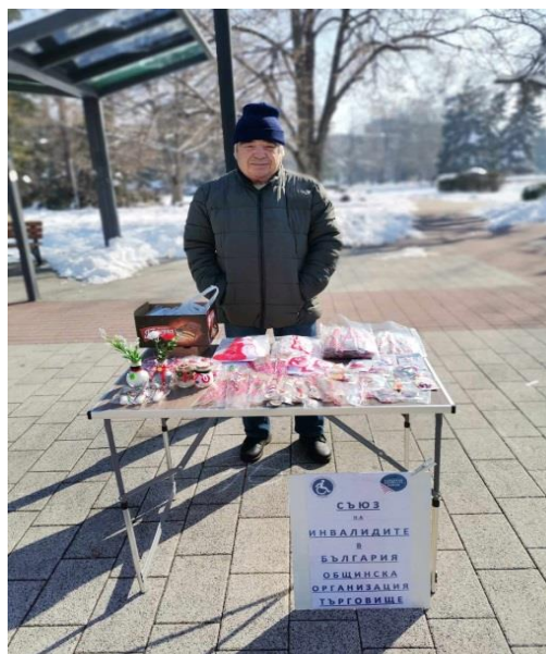
Снимки от изработването и продажбата на мартеници, от м. февруари 2025г.

Така проведената няколкодневна трудотерапия по изработването и продажбата на мартениците, се отрази изключително благоприятно и ползотворно на отзовалите се членове, осъществиха се социални контакти, разведри се ежедневието им, а към дейностите в клуба бе добавена още една инициатива, която е с тенденция да продължи и в бъдеще, чрез още участия в изложби и базари.