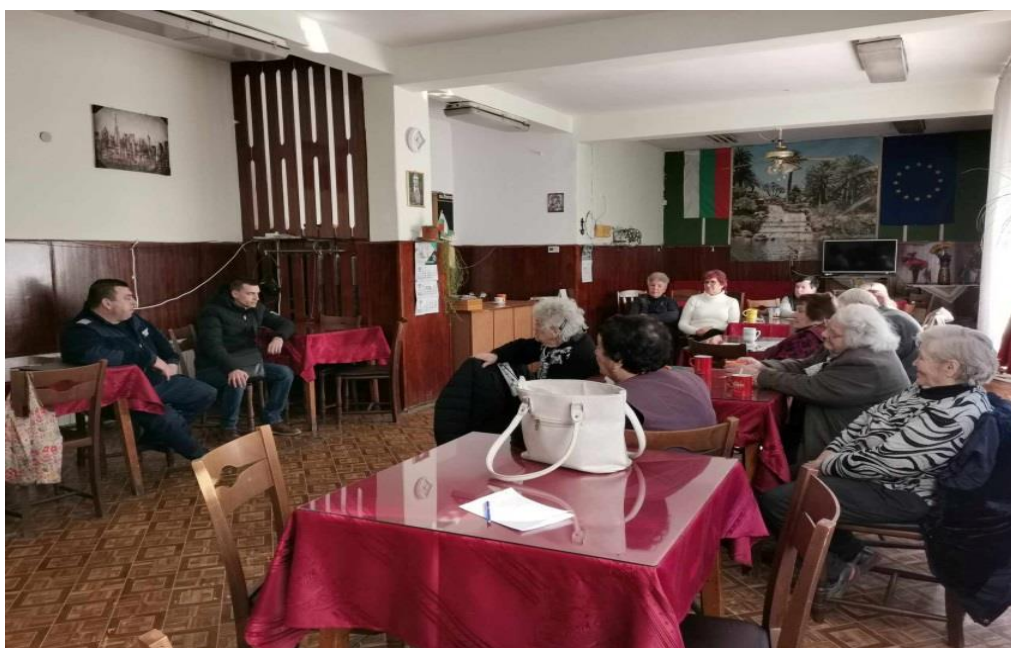
05.03.2025г. - информационна среща със служители на ОД на МВР- Търговище

На 05.03.2025 г. членове на търговищкия клуб взеха участие в среща с представители на ОД на МВР- Търговище. Темата отново бе превенция на зачестилите телефонни измами. Голяма част от потърпевшите са възрастни хора, като присъстващите споделиха и свои преживявания с подобен род подвеждащи обаждания. От служителите на дирекцията бе подробно обяснено кой, защо и по какъв начин има право да поиска съдействие при възникнали ситуации и в тази връзка отправиха апел към възрастните хора да не се поддават на провокации по телефона, да не дават каквито и да било суми или ценни предмети на нелегитимни лица и др.