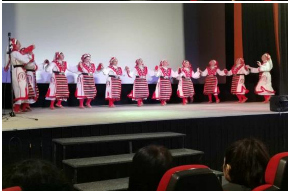
12.03.2025г. Кадри от благотворителния концерт "От сърце за сърце"

Във връзка с отбелязването на 14 февруари - Трифон Зарезан, за 25 от търговишките членове бе осигурен безплатен транспорт до местността „Парка“ край Търговище.