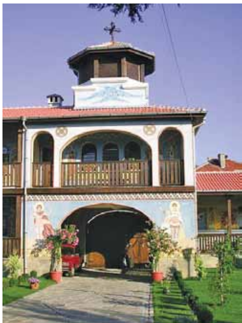
Кърджалийския храм «Успение Богородично»

Именно този дух човешки, който е непобедим и непоклатим, особено силно изразен у хората в такова телесно състояние, е всепобеждаващ. От историята и човешкото развитие знаем, че често пъти хора, които са с телесна немощ, се явяват като духовни титани. ■