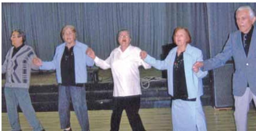
Така се веселят!

- Аз бях доволна от г-жа Авджиева. Например през