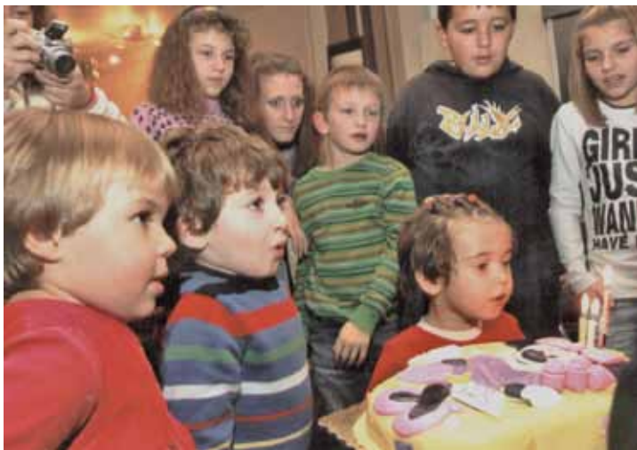
Рожден ден на най-малкото внуче Ивайла

► по-трудно. Много от тях нямат свои семейства и отдават всичко на роднините си, защото иначе друга работа се намира трудно. В семейства, в които има човек с увреждане, се отнасят по адекватен начин и към другите инвалиди. Но не навсякъде е така. Знам за един много неприятен случай с дете, за което се грижат майка му и баба му. То посещава училище в, което има паралелка с ресурсен учител - макар и един за три паралелки. Веднъж класът на това дете организирано тръгва из града и детето инвалид остава само в стаята.