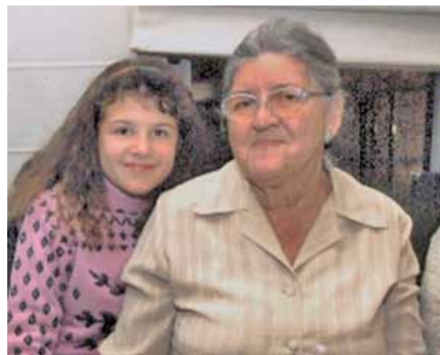
С голямата внучка

автора за днешния ден в иначе красивата ни Родина. Къде са вкусните ни домати, ябълки? Чуваме ли звъна на стадата? Добре е казал народът: „Спасението на давящия се е в ръцете на самия давящ се“. От майката, от бабата, от учителката зависи да научим децата си да работят, да обичат Родината в която