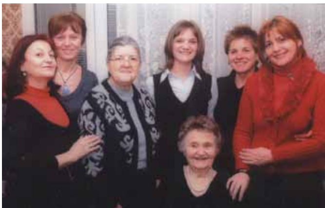
Празници с колегите

литика, събират се да си поприказват, да се повеселят... Но провеждаме и здравни беседи, и други интересни