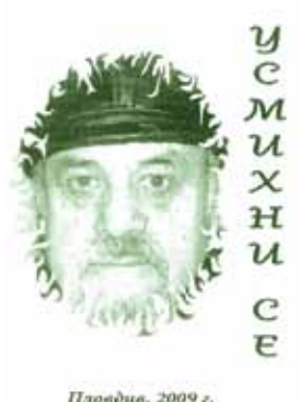
Пловдив, 2009 г.