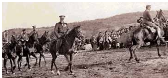
Цар Фердинанд със своя щаб се отправя към войсковите части, обсаждащи Одрин.

също не са безучастни към създаването на Балкан-