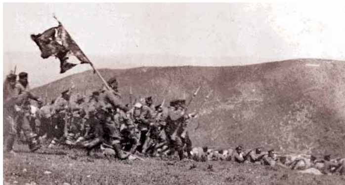
Българската пехота в атака край Люлебургас, 1912 г.

ски съюз. В Европа са формирани два военни политически блока – Ан-