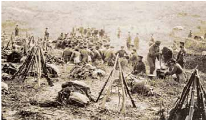
Българската пехота преди атака в близост до Одрин.

► ниците от двата блока и главно Русия като източно православна християнска държава, каквито са и съюзниците, се стремят да привлекат на своя страна с цел предстоящ военен сблъсък. Затова в България е съставено правителство от русофили, а петото Велико народно събрание