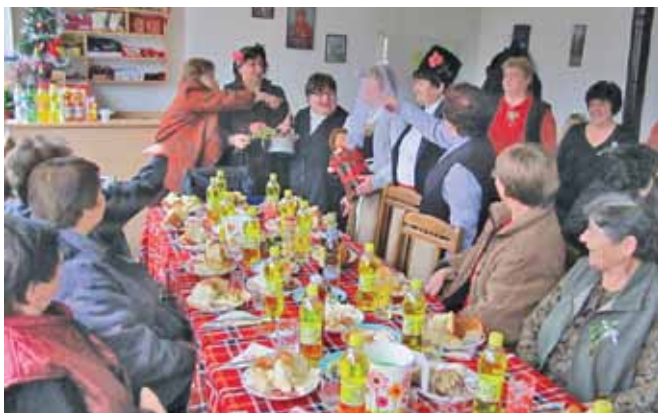
После естествено имаше почерпка с на здравици и веселие