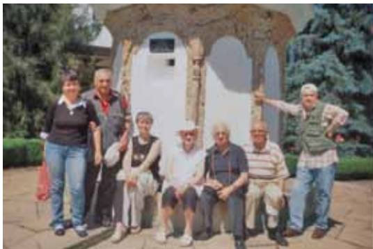
На Соколския манастир

Съвместно с колеги от Съюза на слепите изградихме спортен клуб „Раховец - 2011" и организирахме спортен риболов. Състезателният дух и успешният улов бяха възнаградени, имаше и грамоти. А тази година събитието се проведе на язовир „Ал. Стамболийски. Проведе се