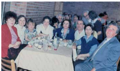
Среща - 2004 г.

Трудовата заетост и професионалната реализация се осъществяват от ДСП, от общината и Бюрото по труда чрез разработване на проекти и включване в националните програми - личен / социален асистент и домашен помощник, обществена трапезария, „Красива България”,